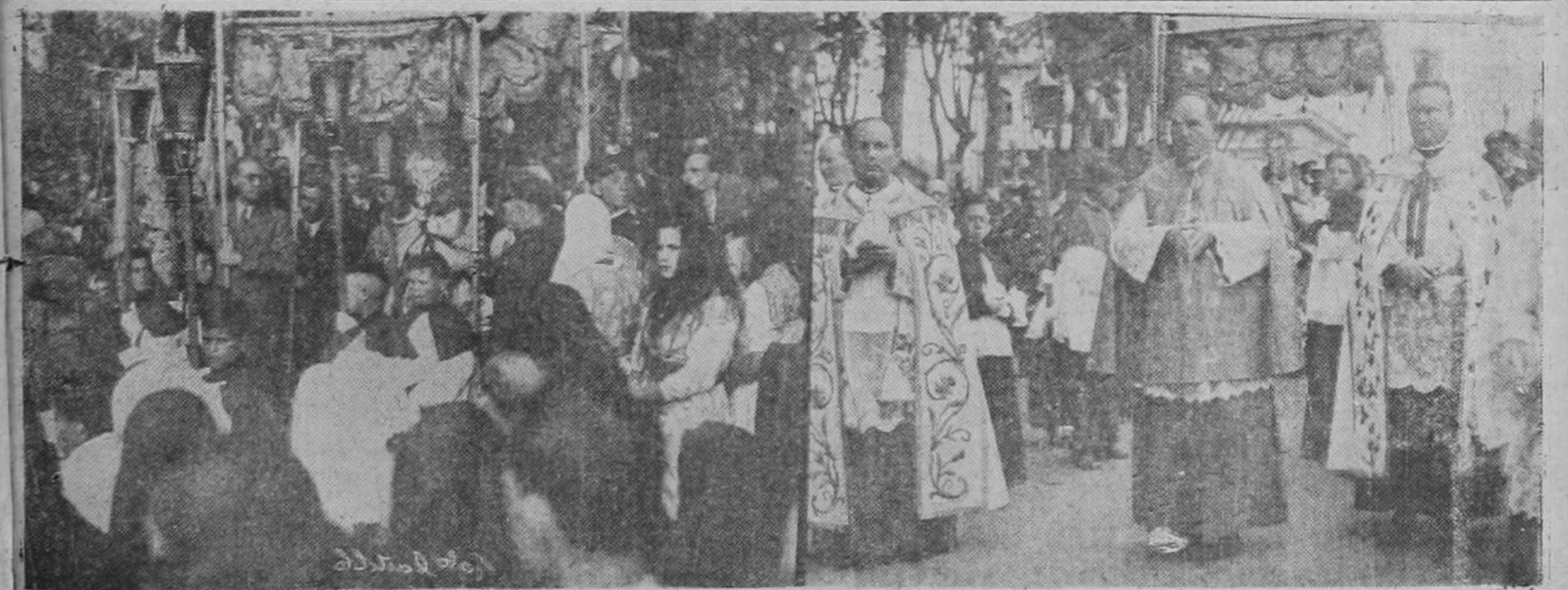
Briantes, espléndidas, magnificas, como quizás en muy pocas oportunidades en nuestro país, resultaron las celebraciones Eucarísticas de ayer en la hispánica ciudad de Cartago. El Nuncio Papal y todo el Episcopado nacional; las altas autoridades civiles de Cartago, el Estado Mayor y una compañía del ejército bajo al dirección del Cor. Pacheco y miles de miles

En los círculos relacionados con los tribunales superiores de justicia desautorizanse informaciones periódicas relativas a posibles inmediatas cesantías de magistrados, por jubilaciones. Si bien es cierto, — nos han dicho varios interesados — que algu- (PASA a la Pág. CINCO)